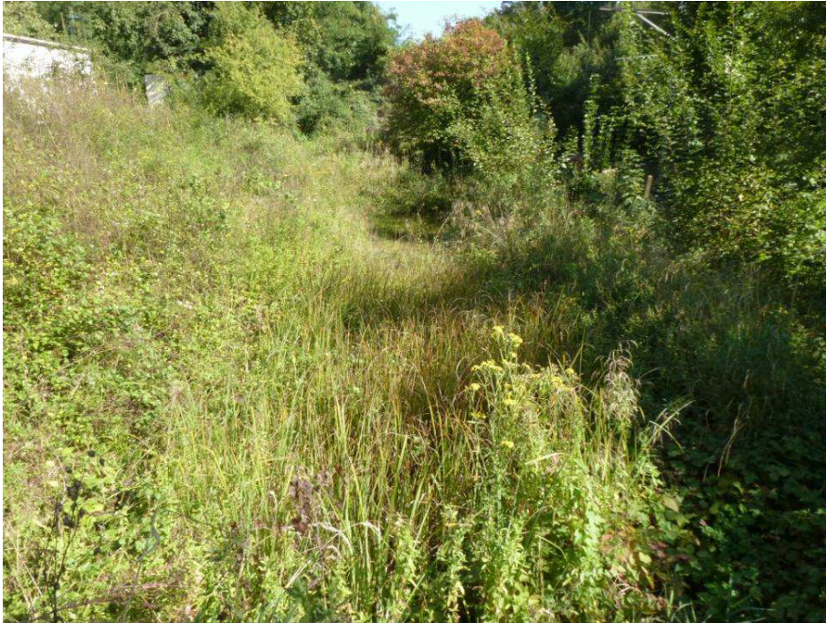
43.458 Unteri Hard; stark überwachsen Feuchstellen